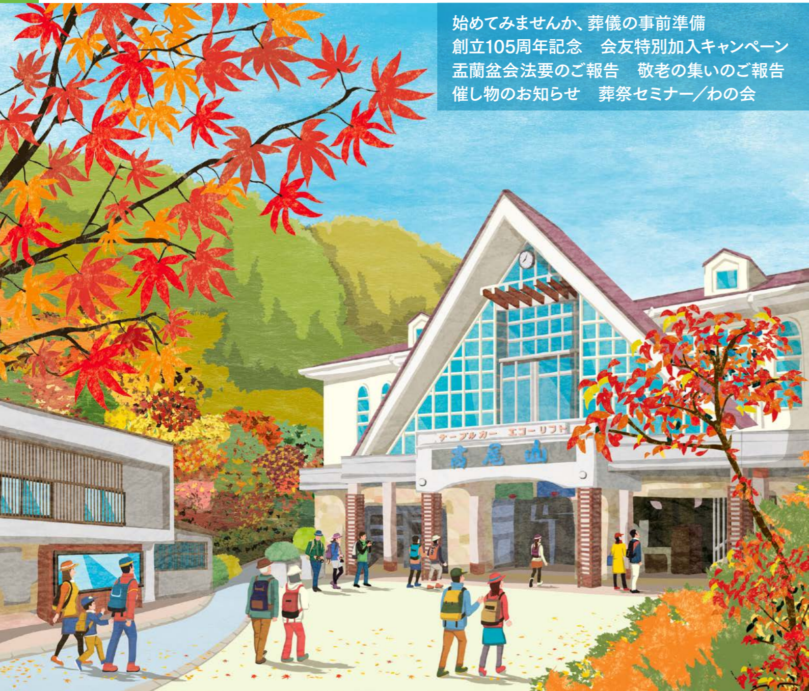
秋の高尾山 清滝駅

始めてみませんか、葬儀の事前準備 創立105周年記念 会友特別加入キャンペーン 盂蘭盆会法要のご報告 敬老の集いのご報告 催し物のお知らせ 葬祭セミナー/わの会