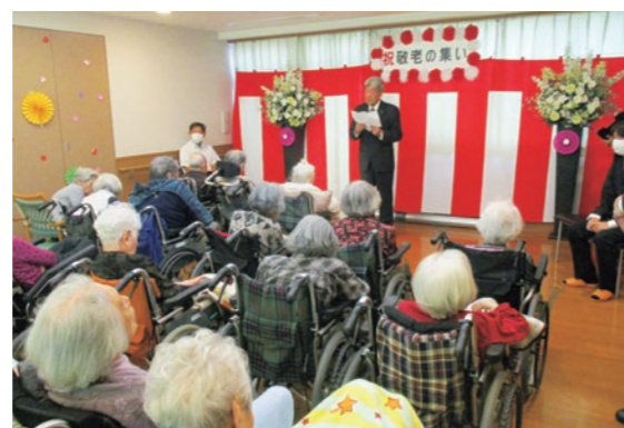
敬老の集いの様子