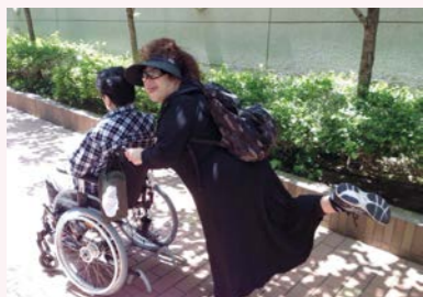
時間が出来ると二人で美容室に行ったり散歩に出かけたりします。

夫のおかげで、私は『障害(者)』という言葉を身近に感じるようになった。『障害(者)』に代わるもう少し優しい言葉はないものかと思う今日この頃。ヘレン・ケラーは障害があっても周りの人たちに恵まれ、支えられ、素晴らしい人生を送った。パリアフリーとかユニバーサルデザインという言葉は浸透しているのかもしれないが、障害のある人にとっての「生きづらさ」は、物理的な部分においても、周囲の人々の心の部分においても、まだいたるところにあると言わざるを得ない。障害者への理解がより深まり、障害の有無を気にすることなく、皆が共生できる社会であってほしいと心から願う。