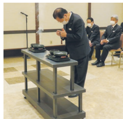
原山理事長 ご焼香