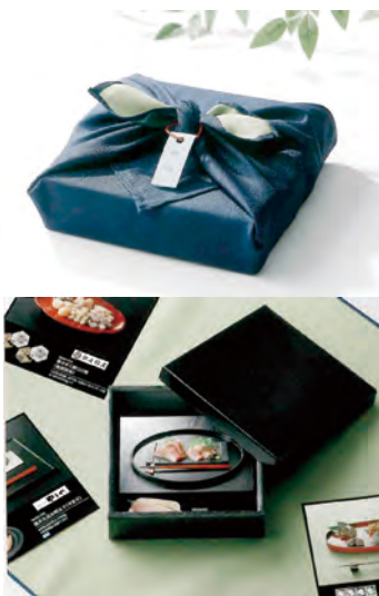
グルメ専門カタログギフト