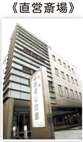
法人本部・道灌山会館 文京区千駄木3-52-1