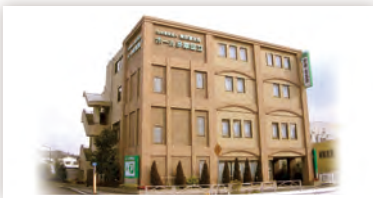
ホール多摩国立 国立市谷保 892-1