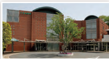
江古田斎場 練馬区小竹町 1-61-1