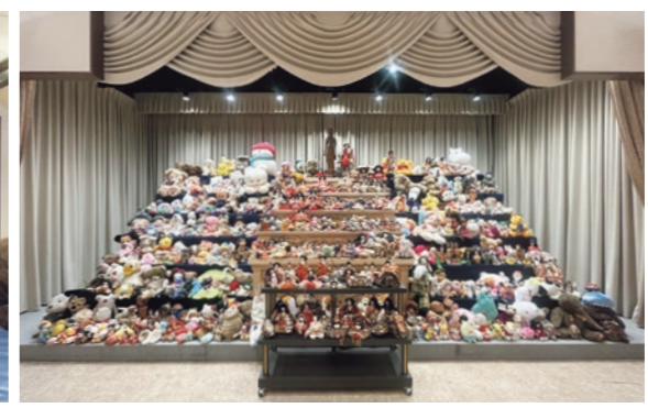
お預かりしたお人形